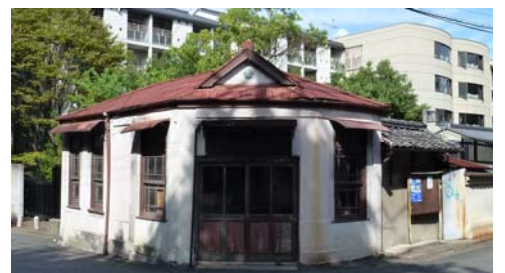
(改修前の鍋屋連絡所)

いろいろな方々のご尽力で、旧鍋屋連絡所(鍋屋交番)が改修され活用されることになりました。今回開催する「きたまち大学校」は、これを機に、建物の保存活用に向けて活動してきた「鍋屋連絡所の保存・活用と“奈良きたまち”のまちづくりを考える会(なべかつ)」と、きたまちのまちづくりを進めている「奈良街道まちづくり研究会(まちけん)」とが協力して、これまでの活動で得たきたまちに関する各種の調査結果などをとりまとめて報告する「大学校」です。みなさま、遠慮なくご参加ください。